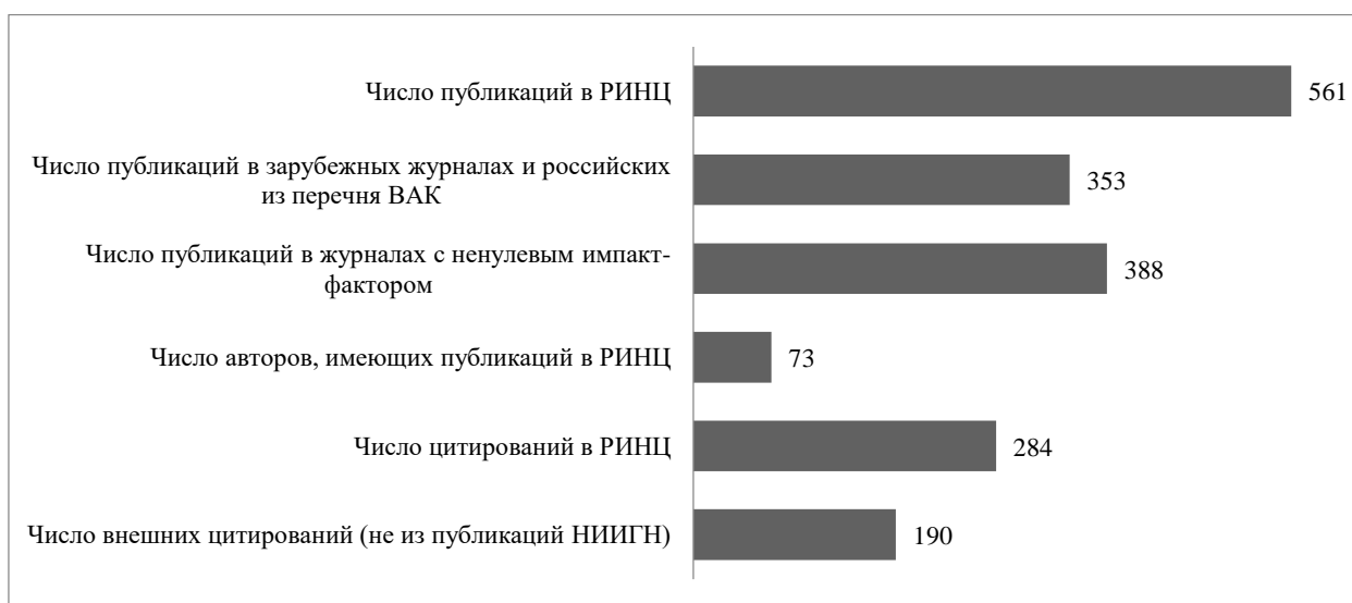
Рис. 1. Показатели публикационной активности НИИГН за 5 лет (2017 – 2021)

Рассмотрим более широкую с точки зрения глубины хронологического охвата статистику публикационной активности НИИГН. Суммарные значения основных библиометрических показателей за 5 лет (2017 – 2021) по данным архива РИНЦ представлены на рис. 1.