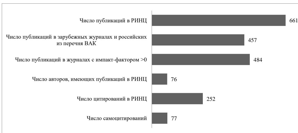
Рис. 1. Показатели публикационной активности НИИГН за 5 лет (2018 – 2022)

Суммарные значения основных библиометрических показателей публикационной активности НИИГН за 5 лет (2018 – 2022) по данным архива РИНЦ представлены на рис. 1.